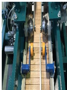
впрессовывание проволоки и растяжка