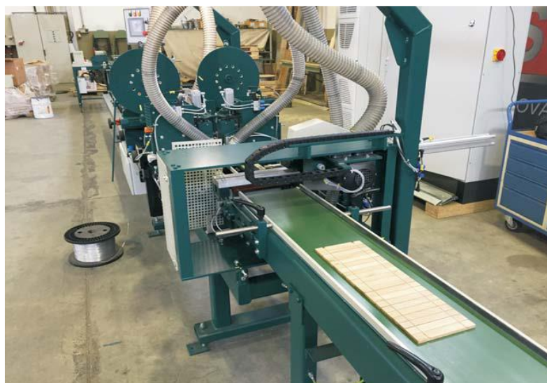
Готовые ковры несущего слоя