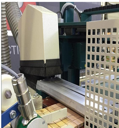
Поперечная обрезная пила для торцевых ламелей

Опционально: автоматическое штабелирование, например на европоддоны.