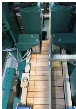
обрезка фрезой проволоки

Ширина ковров (длина ламелей) устанавливается на нужный размер автоматической регулировкой/ позиционным управлением. По желанию с дополнительными (широкими) торцевыми ламелями (из твердых пород или фанеры).